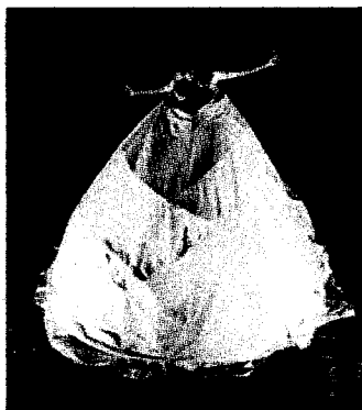
Uno spettacolo del Buratto

Via Mosé Bianchi 94, ore 16.30, 6 euro. Alle 15, laboratorio di teatro d'ombre. 3405939672.