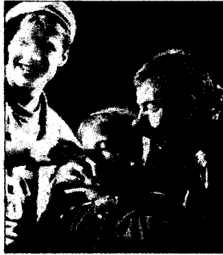
I ragazzi di Bucarest

Clown, giocolieri e mimi. Sono i Ragazzi di Bucarest, guidati dall'artista francese Miloud Oukili, che li ha tolti dalle strade e dai sotterranei della capitale rumena iniziandoli alla magia del circo. Oggi pomeriggio, dalle 16, quest'allegria e colorata tribù, protagonista della campagna "Un naso rosso contro l'indifferenza" lanciata dall'ong Coopi, occupa gli spazi della piazza del Comune di Cremona con uno spettacolo degno dei migliori artisti di strada. In occasione della Festa del Torrone, in piazza anche degustazioni, kermesse di artisti alle prese con sculture dolci, artigiani al lavoro e fuochi d'artificio. (s.ch). Cremona, piazza del Comune, dalle 16