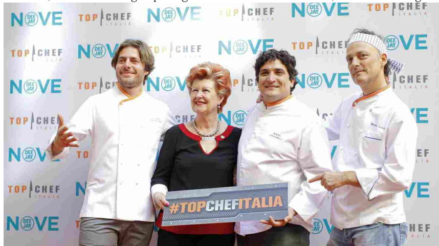
Canale Nove, 1ª edizione di Top Chef Italia: cucin... Canale Nove, 1ª edizione ...