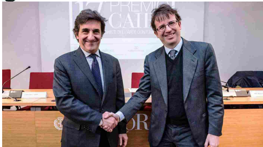
Scelta la Giuria che eleggerà il vincitore del Pre... Scelta la Giuria che eleg...